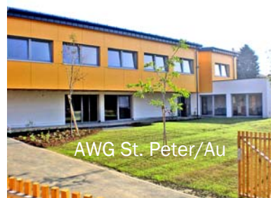
AWG St. Peter/Au

Anders die Geschichte des zweiten Neubaus: Die bereits seit 22 Jahren bestehende Außenwohngruppe St. Peter/Au (Mostviertel) war seit 1987 in einem angemieteten Haus untergebracht, das den Erfordernissen der Betreuung nun nicht mehr entsprechen konnte. An neuer Adresse im gleichen Ort wurde am 14. November