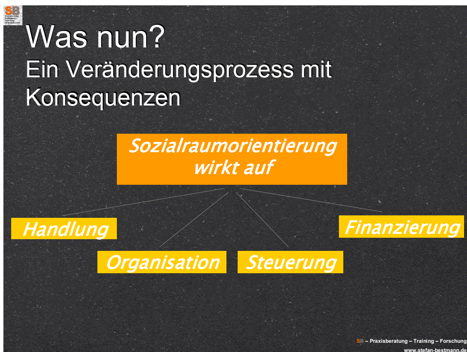
Abb.2: Wirkungsdimensionen eines sozialräumlichen Veränderungsprozesses

Um eine Jugendwohlfahrt in einem kommunalen Bezug entsprechend aufzustellen, braucht es eine Menge an Veränderungsarbeit, bezogen auf das methodische Handeln der Profis, den Organisationsaufbau der Verwaltung und der Träger, die Steuerungsprozesse und die Finanzierungssystematik.